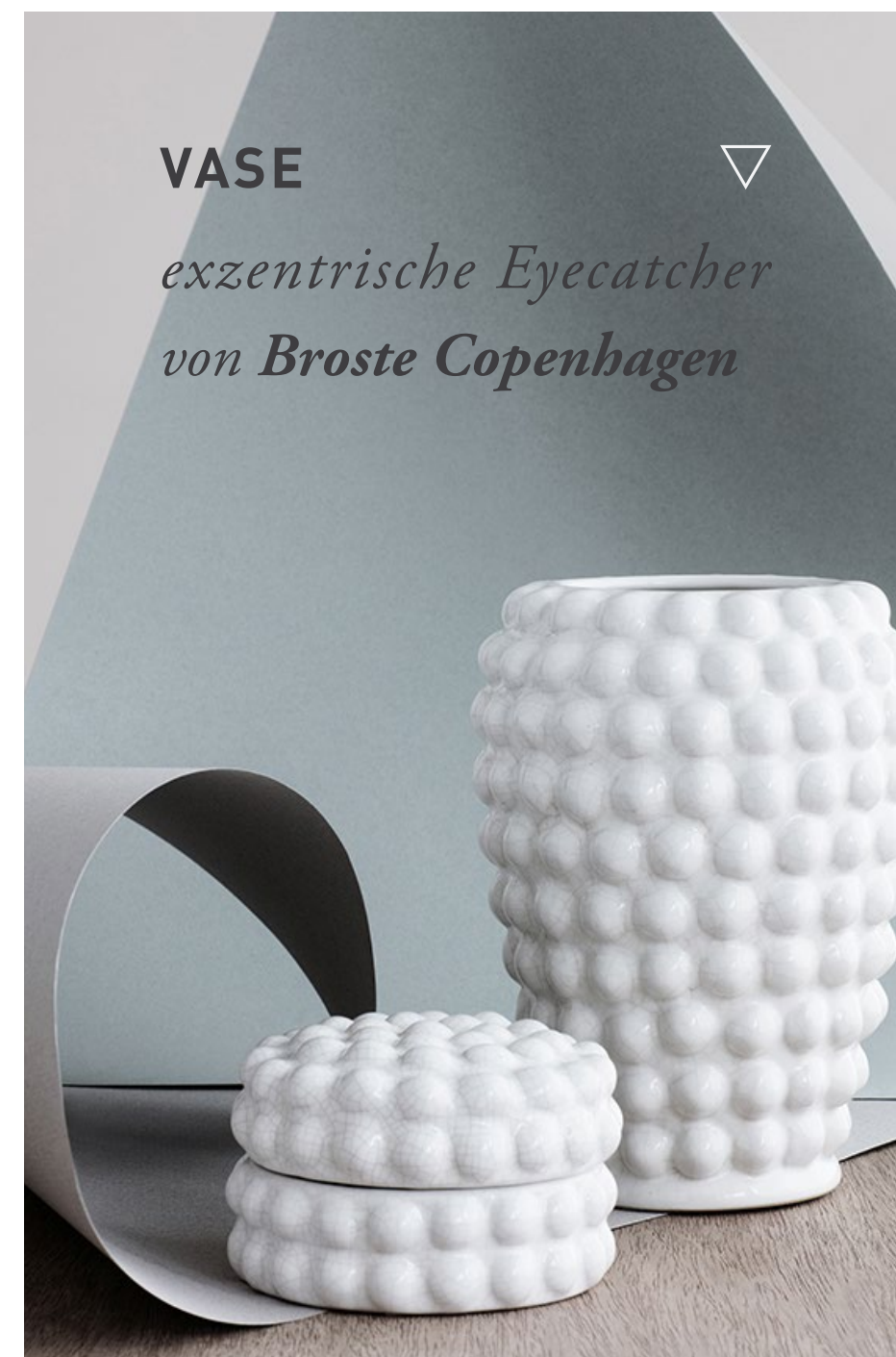
VASE ▽ exzentrische Eyecatcher von Broste Copenhagen ◁ MARMORTISCH ausgesprochen hochwertige Materialien von Ferm Living