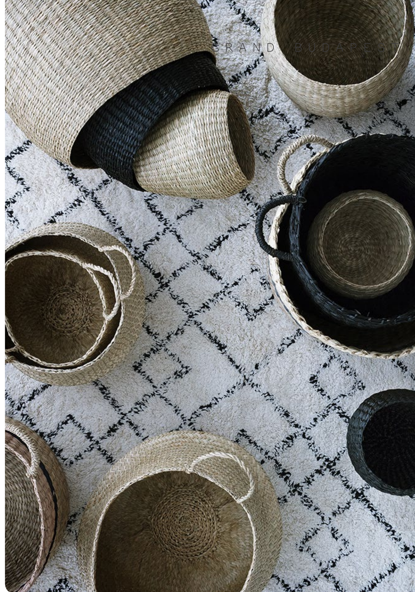
Bast, Rattan, Korb von Broste Copenhagen △